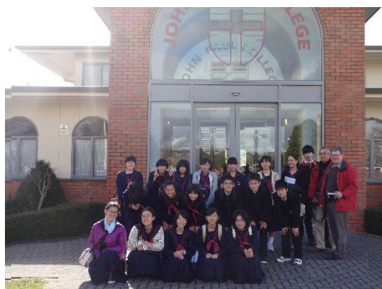
[ニュージーランド・ホームステイ] ※今年も11名の生徒が、夏季休業中に2週間の研修を行いました。

本校への進学を考えている人も、 受検するかどうか迷っている人も、 ただ「附属中学校ってどんな学校？」と興味を持っている人も、 ぜひ多くの皆様のご来校をお待ちしています！！