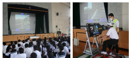
自転車シミュレーターによる実際の交通状況を再現した体験

本校においても、生徒の自転車事故が発生していますので、今後の事故減少につながればと思っています。 生徒たちだけでなく私たち大人も自転車を利用する際は、ヘルメットの着用はもちろん、交通マナーを守り、安全運転に心がけましょう！