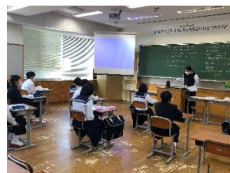
座席は離れて安心の距離