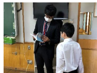
一人一人への声掛け