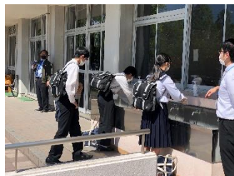
入構前の手洗い 蛇口は触りません

新型コロナウイルス感染予防対策として、校舎に入る前の手洗い、教室に入る前の健康観察、距離を開けた座席配置、そして、生徒が入れ替わることに使用した机やドアの消毒をしています。安全で安心な学校生活にむけ、最善を尽くします。