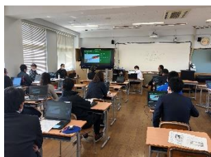
教員のオンライン研修

この度、保護者の皆様のご協力のおかげで、可能な限り家庭での通信環境を整えてくださり、オンライン授業を実施することができました。動画配信も双方向によるオンライン授業も、学校として初めての取り組みですが、質の高い学びが届けられるよう工夫しています。