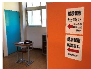
入室前の健康観察