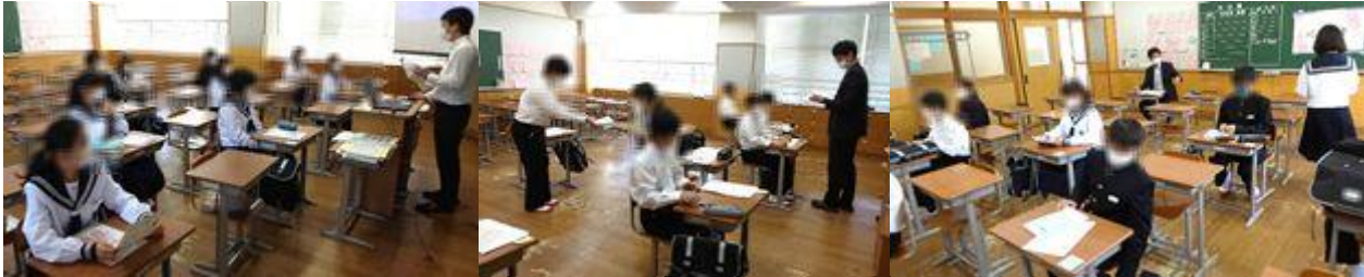
↑ やはり教室、この光景ですね☆