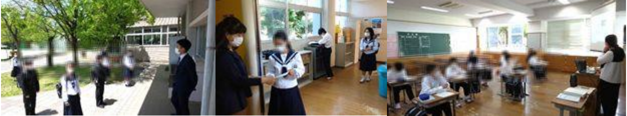
↑ 久しぶりの日差しが眩しい!!